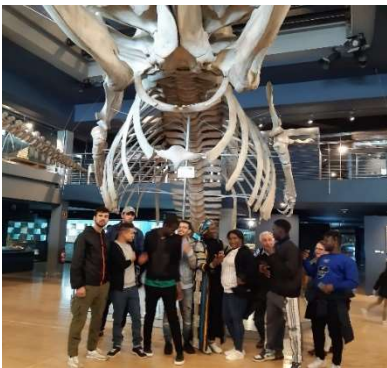
ALUMNOS DE ESPAÑOL VISITANDO EL MUSEO

MUSEO MARÍTIMO salda al museo aprovechando las vacaciones de Navidad