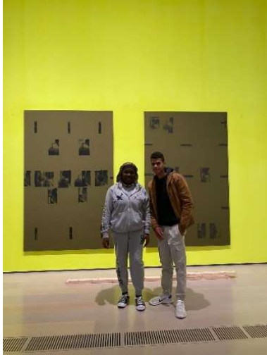
LANDORA Y MILER EN LA PREINAUGURACIÓN DE ITINERARIOS

EL CENTRO BOTÍN nos invita a sus exposiciones y talleres