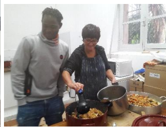
Mercedes deja las telas y se mete en cocina