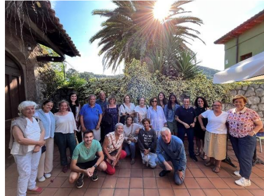
Los voluntarios se van de comida que hay mucho que celebrar